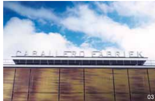
03 Caballero fabriek

‘Nu we in de stad zitten, ontdekken we steeds meer voordelen.’