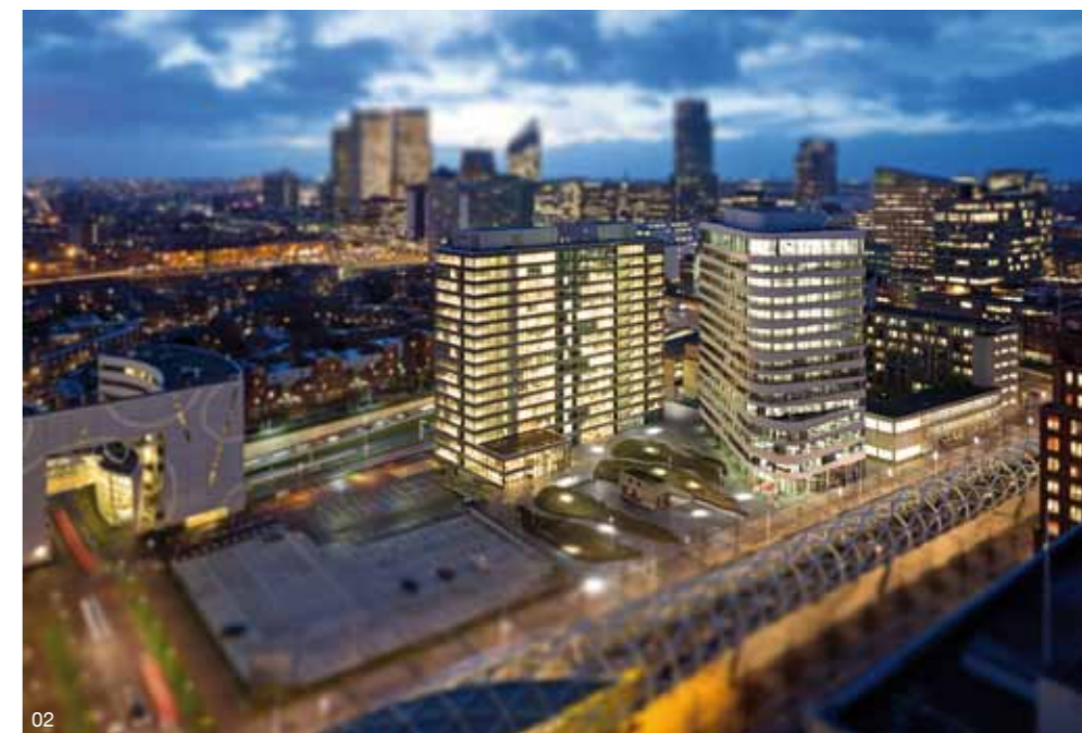
01 Skyline Den Haag